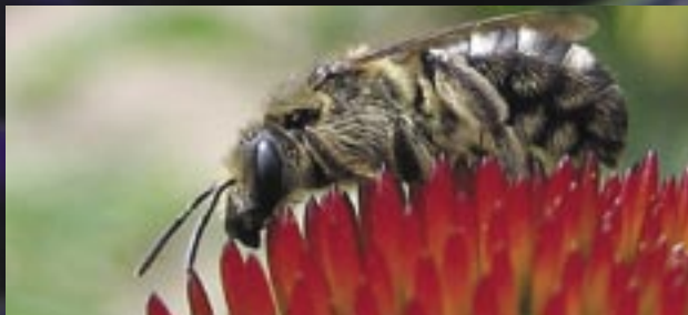
02. Insecto