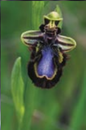
01. Orquídea, Ophrys ciliata ©Humberto Grácio

BirdLife International - www.birdlife.org